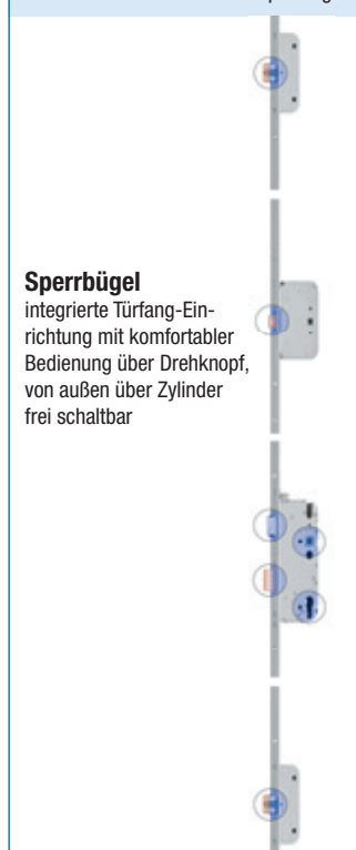
G.U-SECURY Automatic mit Sperrbügel

Nennspannung: 12 V Stromaufnahme: 1 A ermöglicht das motorische Öffnen der Tür